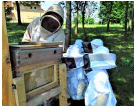
Découvrir le monde du vivant..