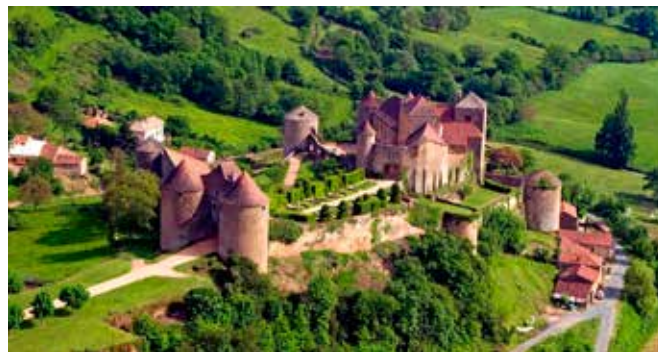
Rêver d'être un chevalier ...