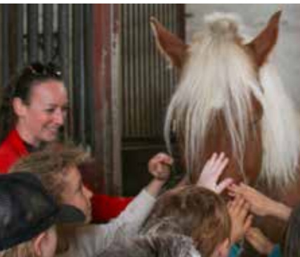
S'imaginer cavalier ...