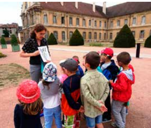
Observer l'architecture ...