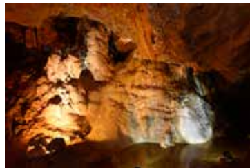
Explorer la vie souterraine ...